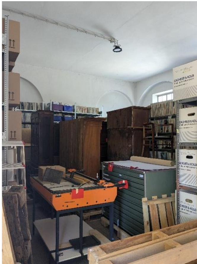
Möbel und Planschränke im Zwischenlager