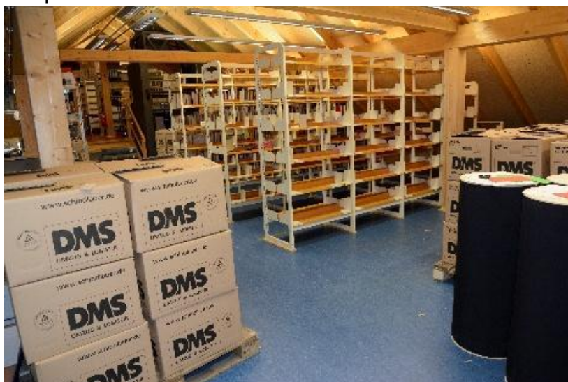
Bücherkisten und leere Regale im Dachgeschoss