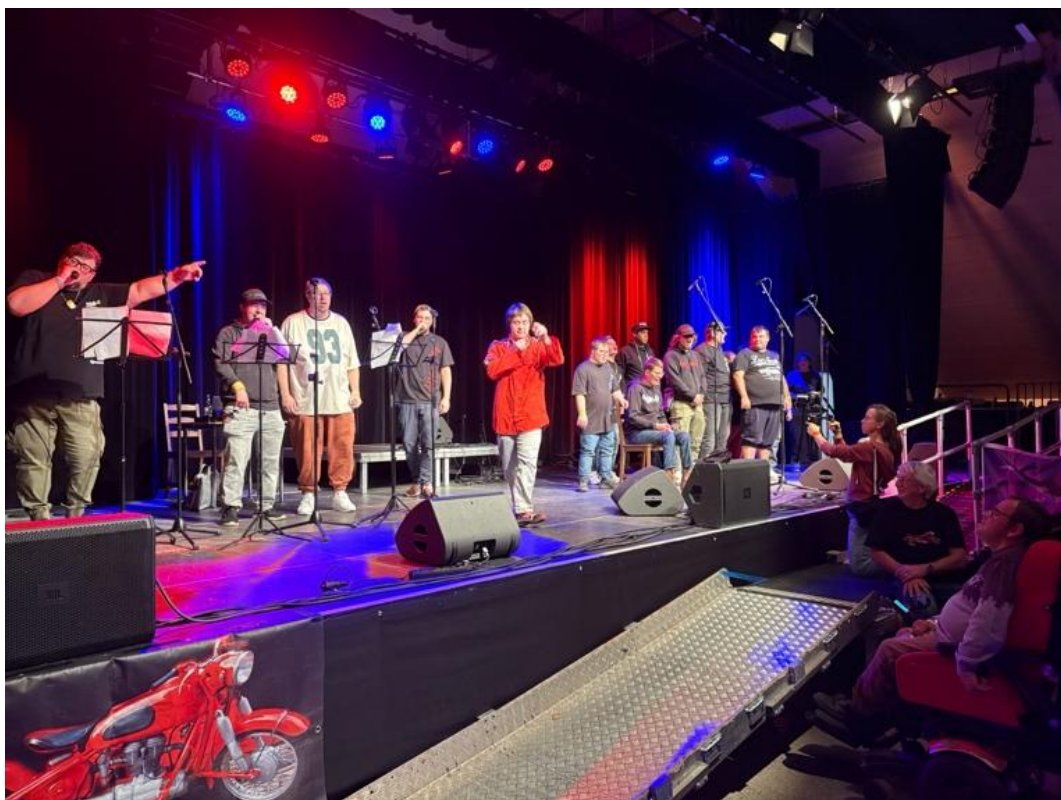
Die Band #igenArt beim Let's Fetz 2025

Abstimmung auf die individuellen Bedürfnisse der beteiligten Bands: musikalische Anforderungen, barrierefreie Zugänge, technische Rahmenbedingungen, Aufenthaltsbereiche sowie die allgemeine Betreuung der Künstlerinnen und Künstler vor, während und nach den Auftritten. Die Zusammenarbeit mit der Schirmherrin Luisa Wöllisch, die als Schauspielerin selbst mit einer Beeinträchtigung lebt und sich aktiv für die Förderung inklusiver Kulturformate einsetzt, trug wesentlich dazu bei, dass der Ablauf des Festivals sowohl organisatorisch als auch inhaltlich sensibel und inklusiv gestaltet werden konnte. In Verbindung mit der vielfältigen Abstimmung mit Partnerinstitutionen, Veranstaltungsorten und unterstützenden Teams, konnte so ein Forum geschaffen werden, in dem künstlerische Freiheit und gesellschaftliche Teilhabe gleichermaßen im Mittelpunkt standen. Ziel war es einen sogenannten „Safe Space“ für Künstlerinnen und Künstler zu schaffen.