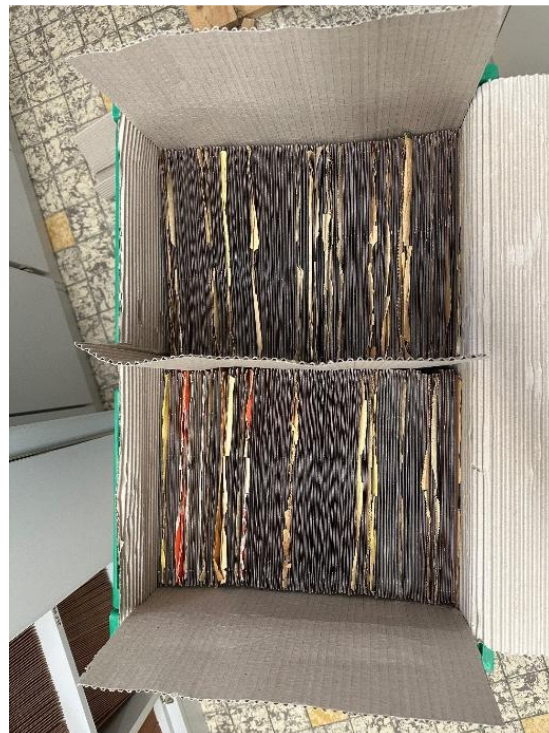
Verpackte Schellackplatten (li) und Schallplatten (re)