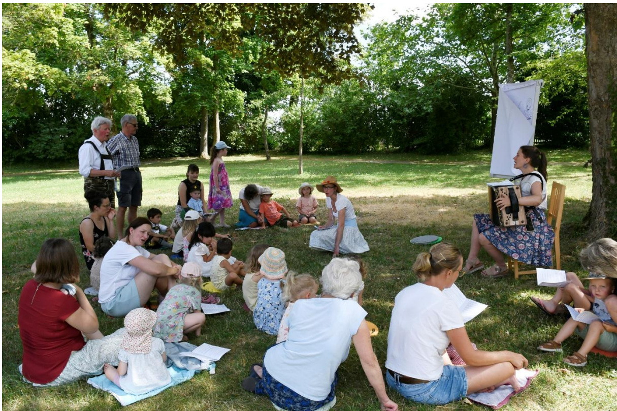
Familiennachmittag im Garten vor dem ZeMuLi