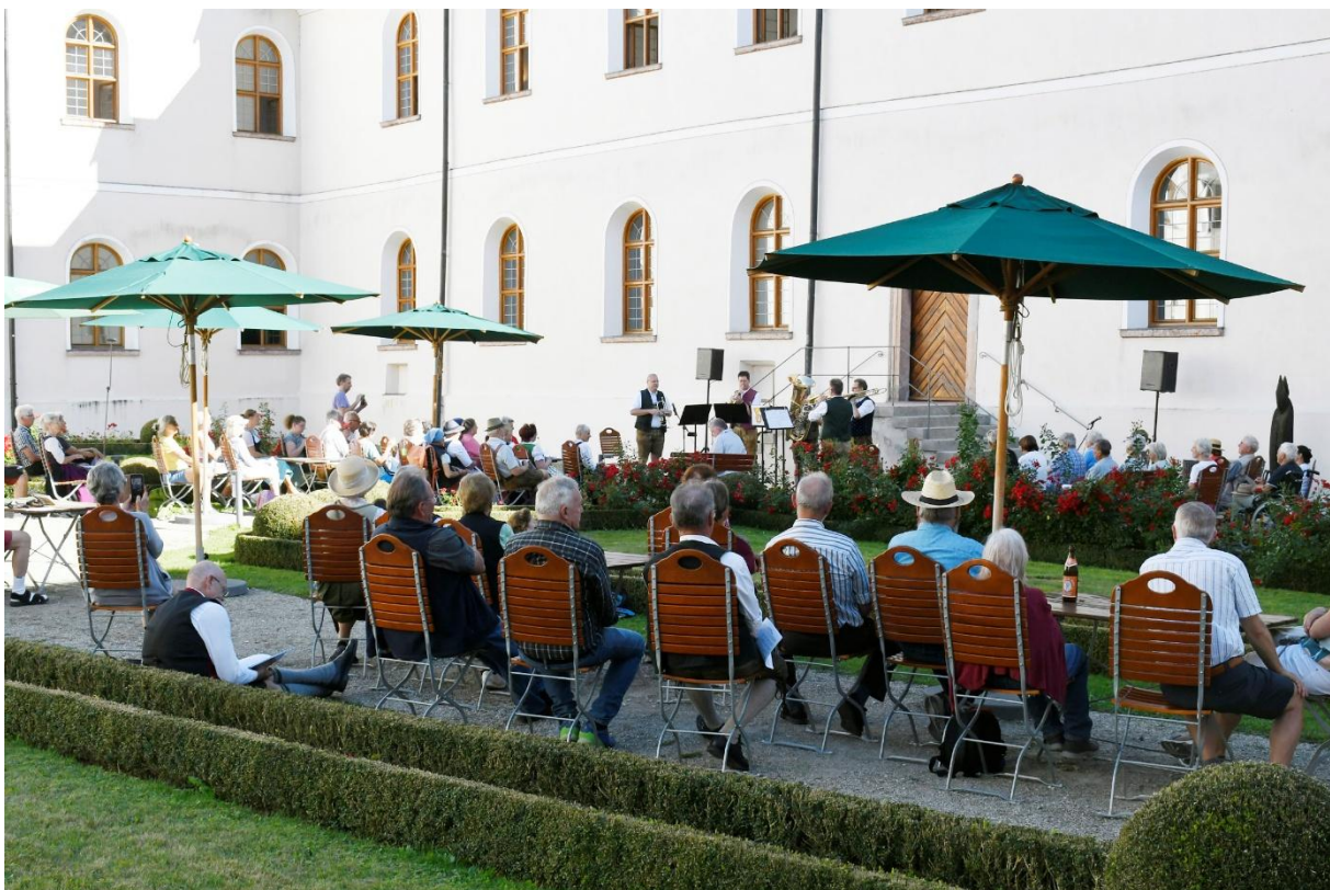
Vorstellung der neuen Publikation Blechbläserquintett 2 mit der Gruppe Liaba Brass beim Tag der Volksmusik in Kloster Seon