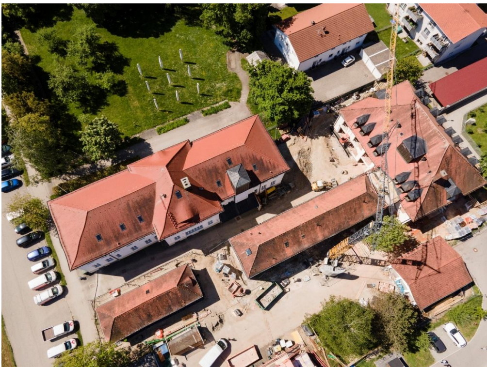
Luftbild des Geländes am Standort Bruckmühl