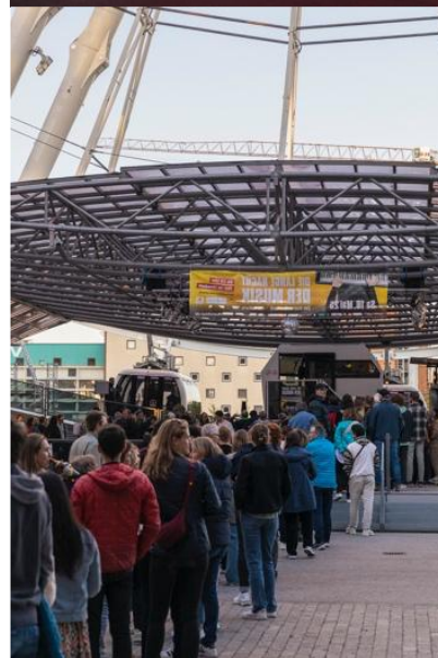
Eindrücke vom Umadam Riesenrad