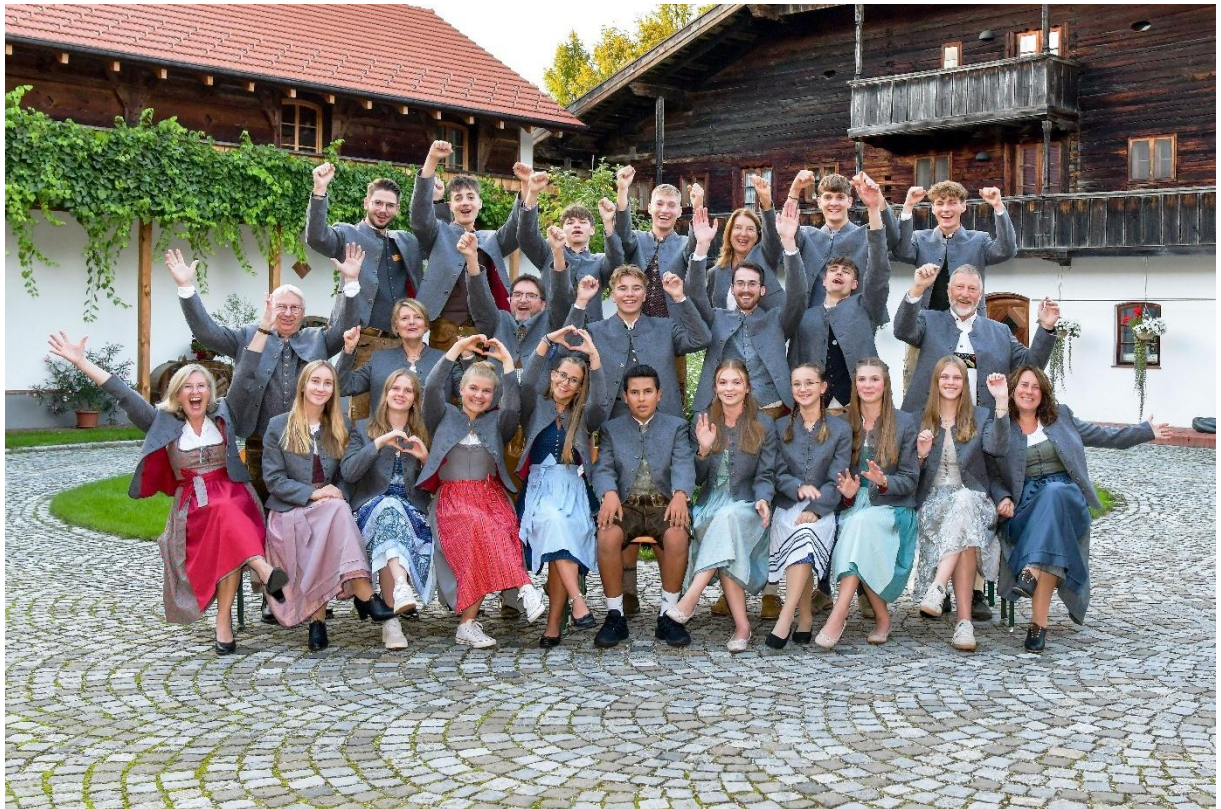
Umsetzung des Vorschlags